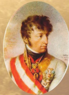
Erzherzog Karl von Österreich

Die immense Zahl der Verletzten musste in notdürftig eingerichteten Lazarett untergebracht werden. Scheunen, der Bräukeller, sogar die Kirche wurde dafür ausgeräumt. Der Bräukeller ist seit dieser Zeit übrigens der Franzosenkeller. In den Wäldern nördlich von Teugn bezogen die Divisionen der Generäle Friant und Hilaire nach der Schlacht zwei weitere Tage Biwak bis zum 21. April.